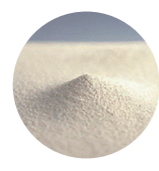
▲コーキンマスタールパウダー